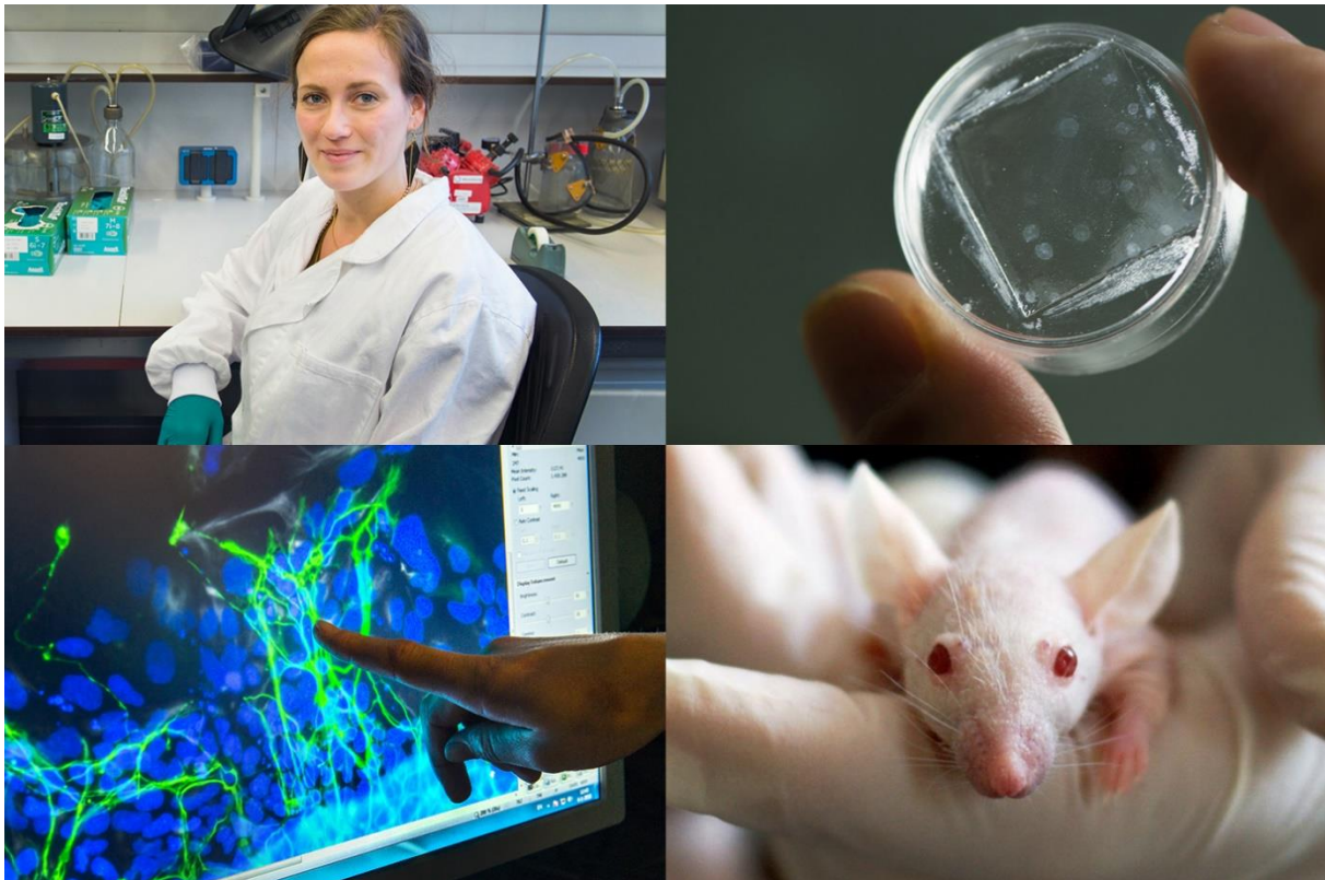
Beelden van de website van Proefdiervrij over het project 'Betere bescherming ongeboren baby's'