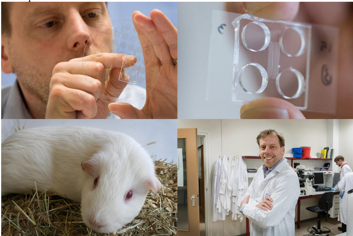
Beelden van de website van Proefdiervrij over het project 'astma-op-een-chip'.